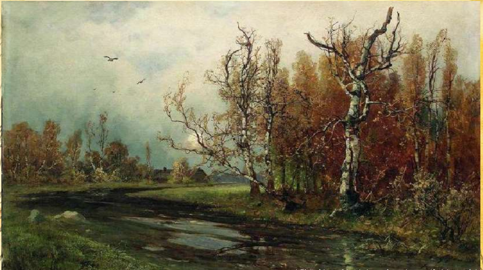
А. Саврасов «Осень»