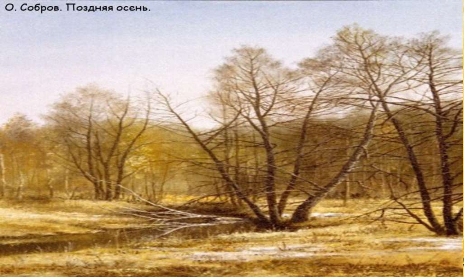
О.Соборов. «Поздняя осень»