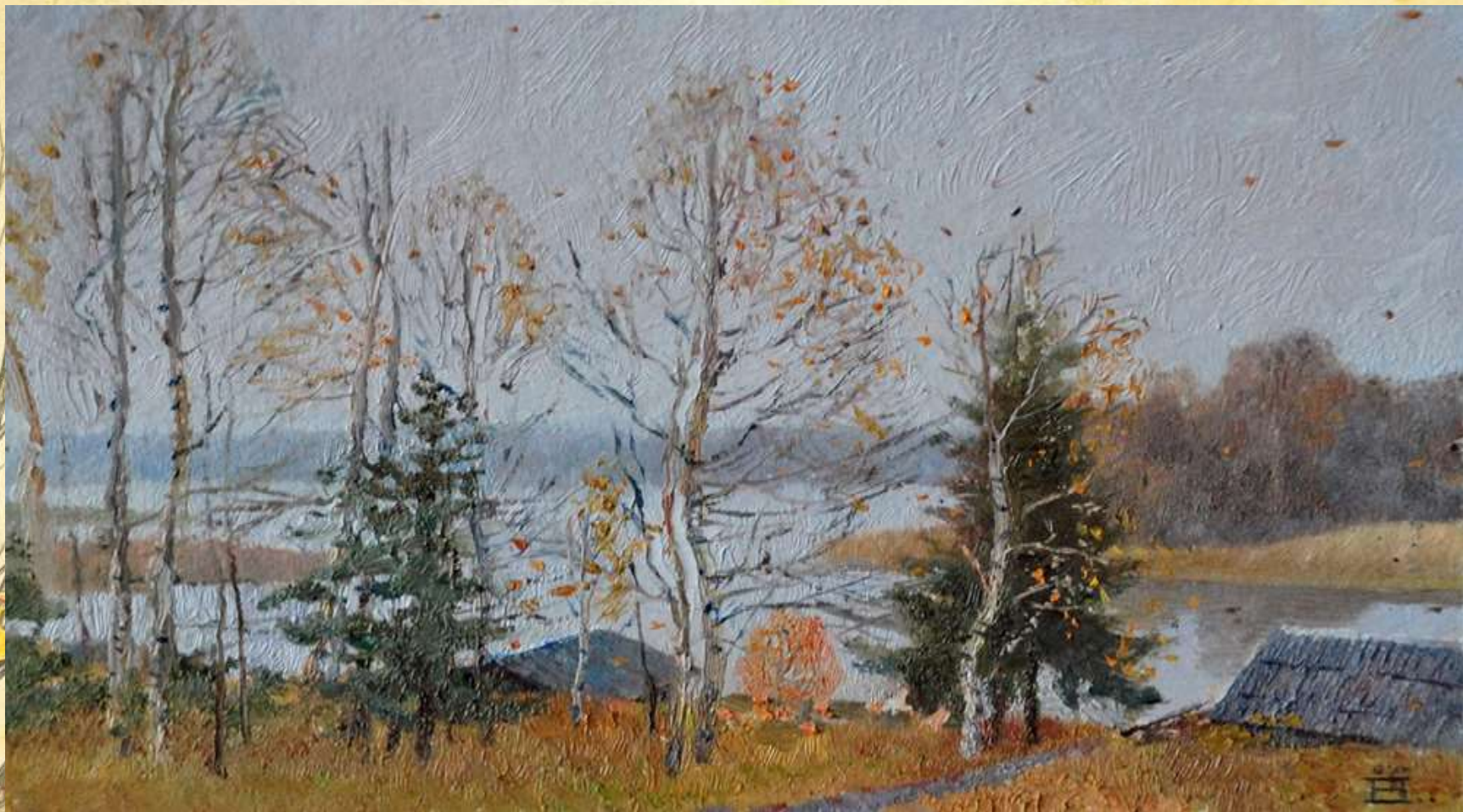
Е.Прудникова «Поздняя осень»