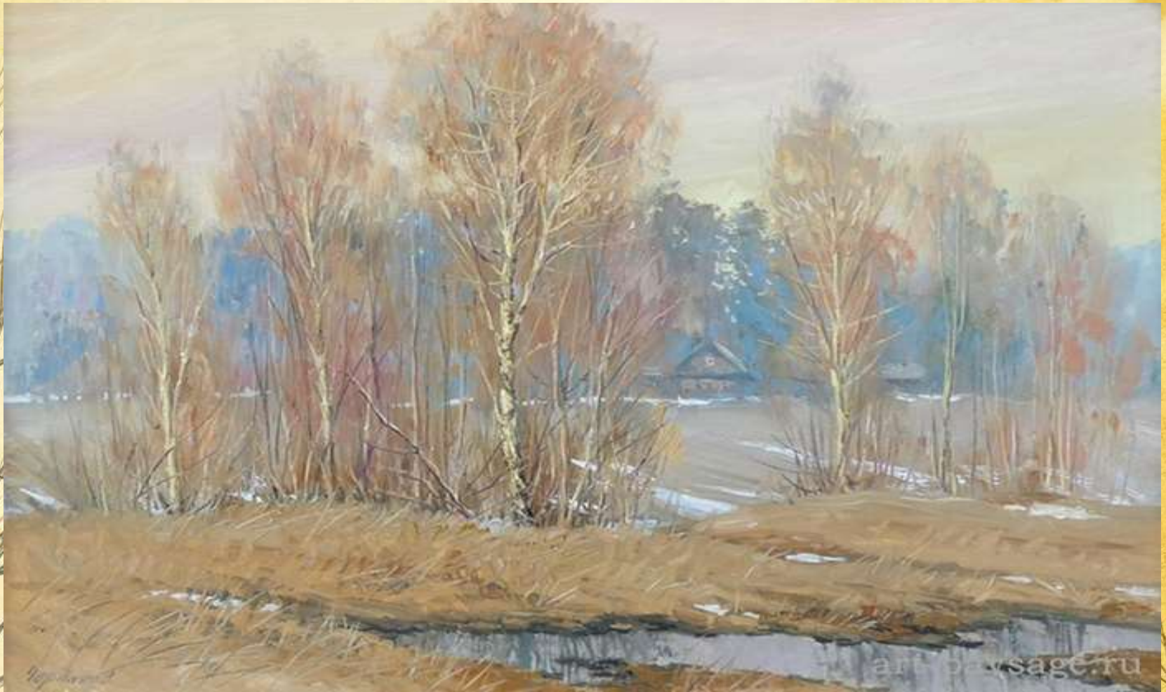
И Левитан «Поздняя осень»