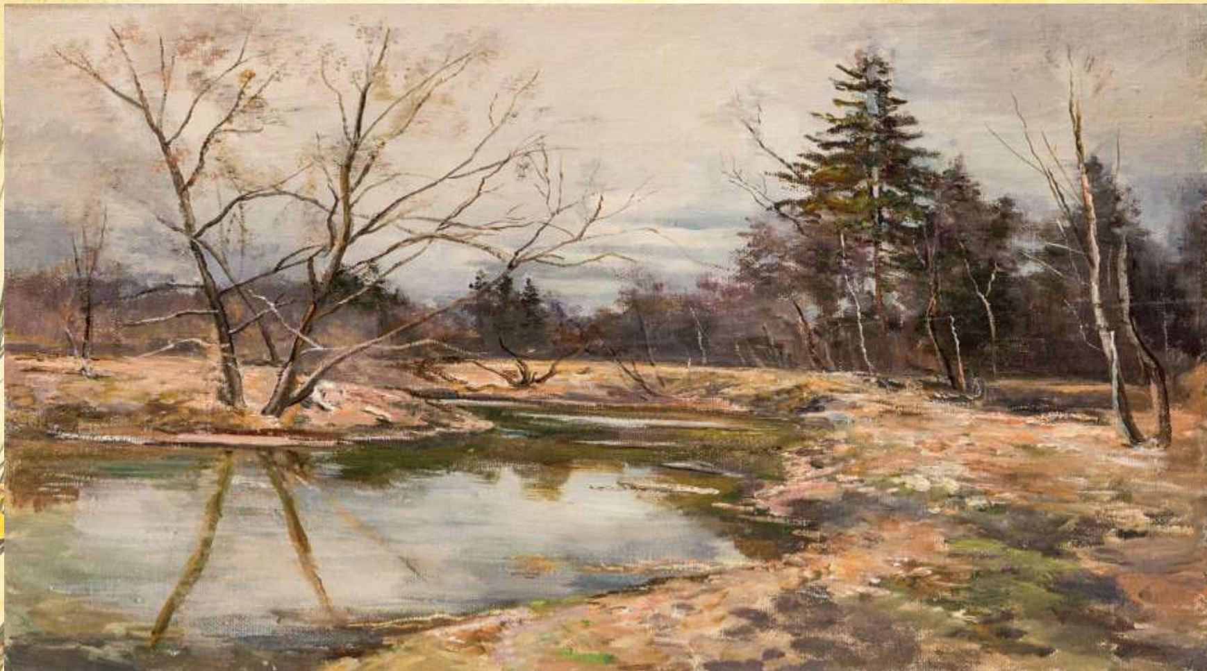
А. Саврасов «Осень»