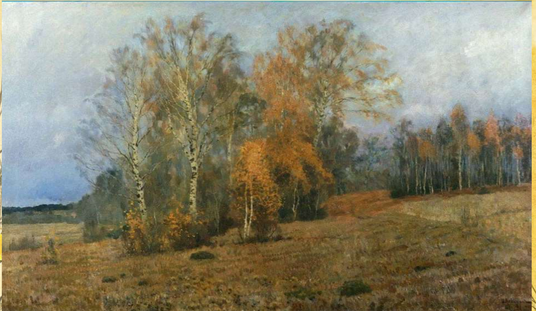
И.Левитан «Октябрь. Осень»