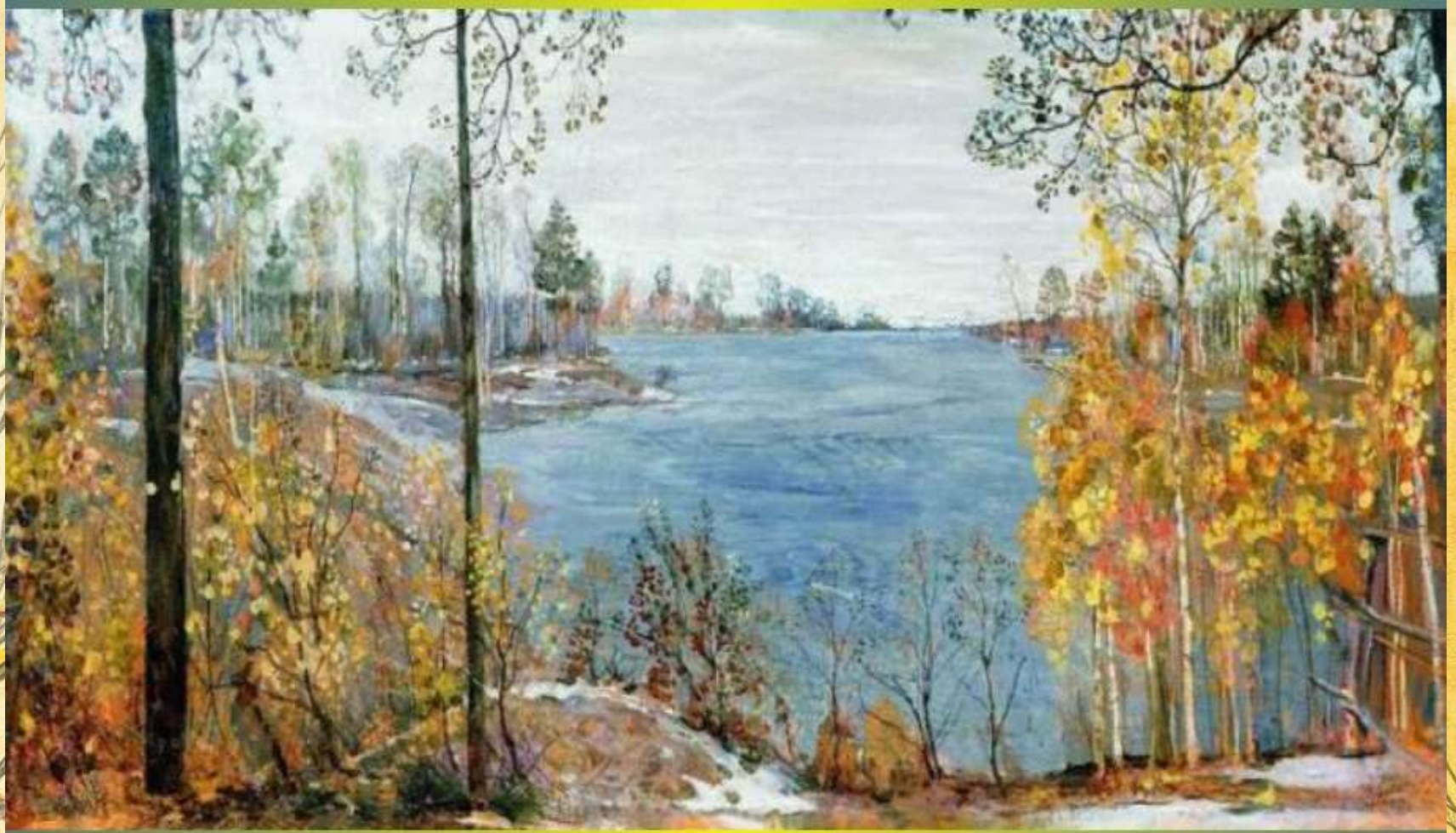
И.Бродский «Поздняя осень»