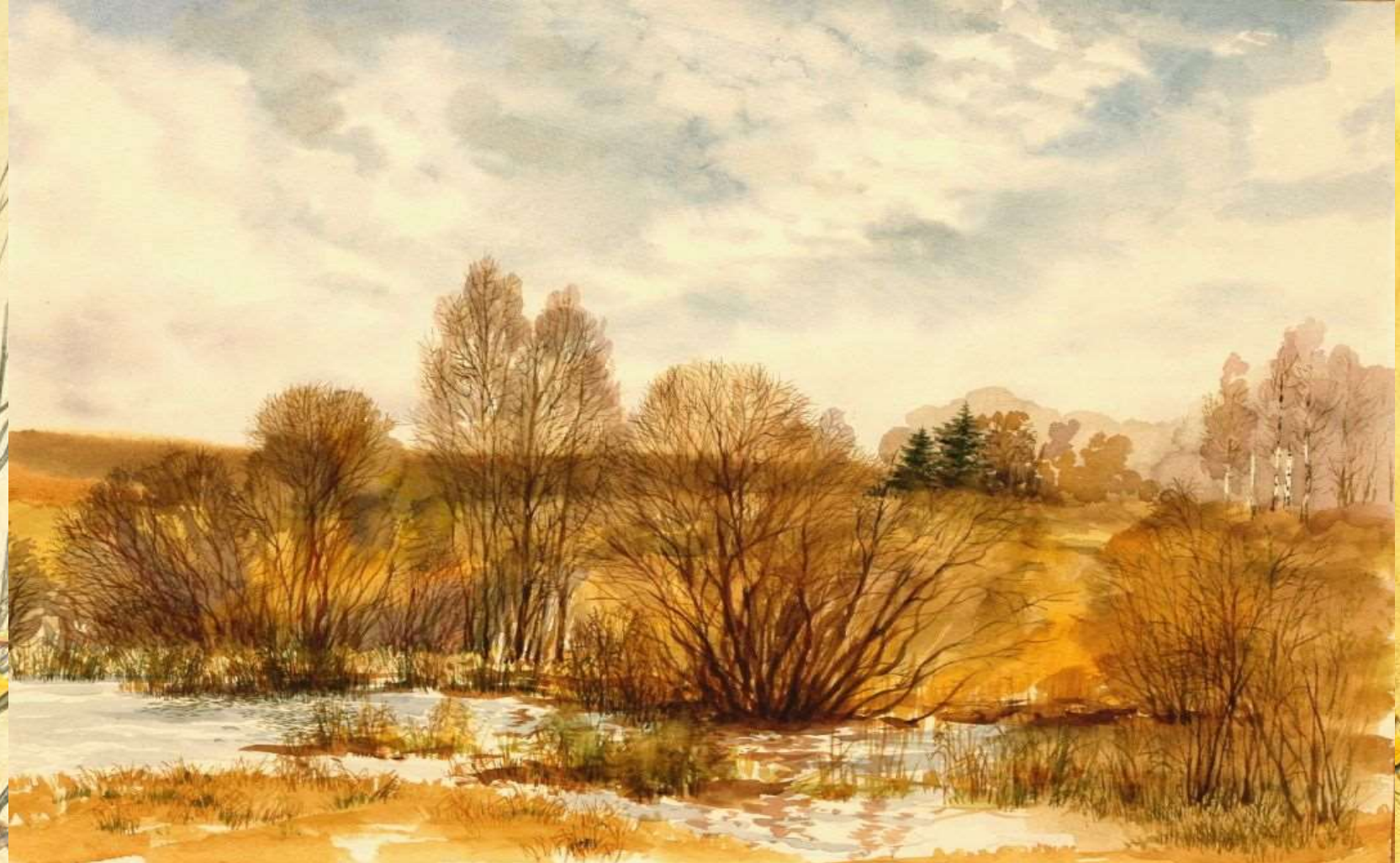
А. Саврасов «Поздняя осень»