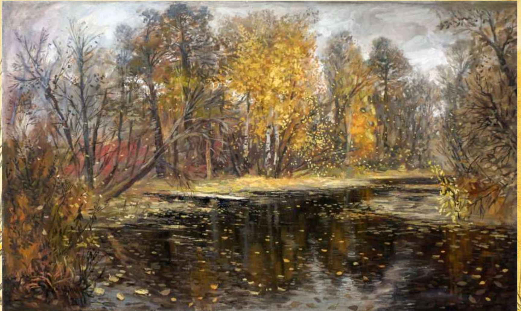
Неизвестный художник «Поздняя осень»